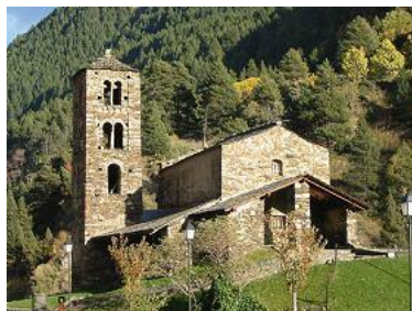
Kirko "San Joan de Caselles".

Andorra la Vella, qua vicinasas la parokio Escaldes-Engordany e la strado-vilajo Santa Colomo, ensemble kun oli divenis unika domaro ye plu kam 25 000 habitanti. Vitro, betono, metalo e marmoro, qui uzesas por la konstrukto dil edifici e publika acensili ye la servo dil parkeyi dil urbo-mezo, donas a la chefurbo anciena di ca landeto semblanta aspekto di granda chefurbo.